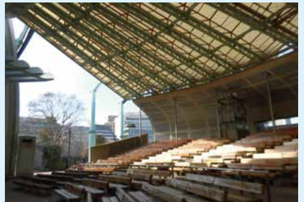
上野恩賜公園野外ステージ 水上音楽堂 観客席

台東区芸術文化財団の窓口にて返金させていただきます。 払戻し期間等の詳細は、ホームページをご確認ください。