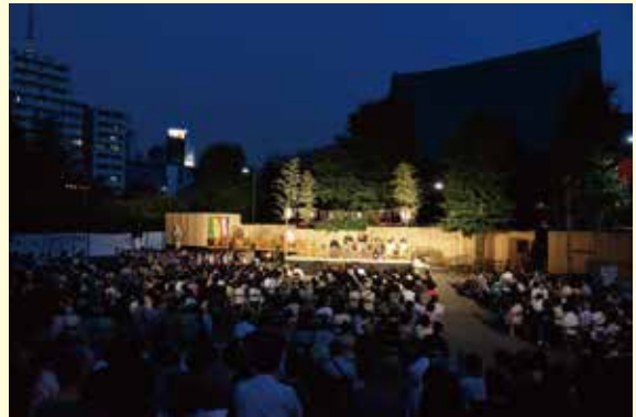
「過去の公演の様子（金龍山浅草寺境内）」