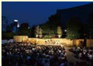
「過去の公演の様子」