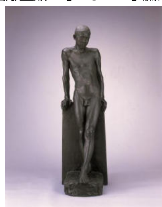
<朝倉文夫《若き日のかけ》1912年>