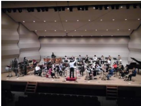
<令和2年度 下町大音楽市>