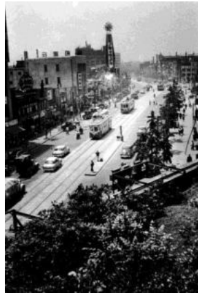
<昭和30年代の上野広小路>