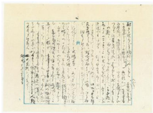
<樋口一葉自筆「たけくらべ」未定稿>