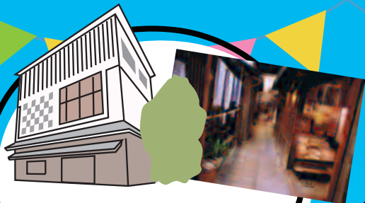
下町风俗资料馆 因改建工程停馆