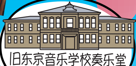
旧东京音乐学校奏乐堂