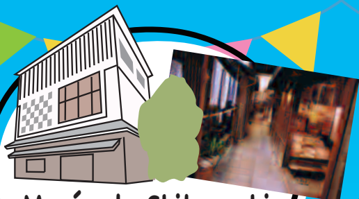
Musée de Shitamachi Fermé pour travaux de rénovation.