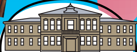
Sogakudo de l'ancienne école de musique de Tokyo