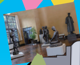
Musée de la sculpture ASAKURA