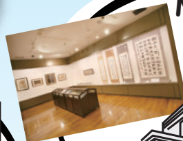
Musée de la calligraphie