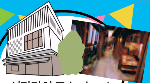
시타마치 풍속 자료관 리뉴얼 공사로 인한 휴관