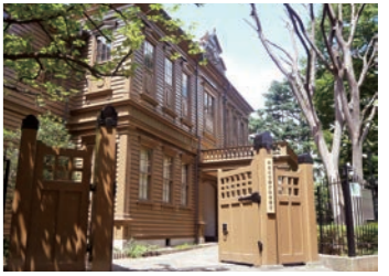
旧東京音楽学校奏楽堂の外観