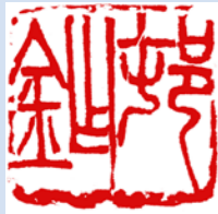
「村鉾」朱文方印 呉昌碩刻 台東区立書道博物館蔵