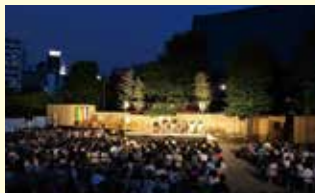
「過去の公演の様子」